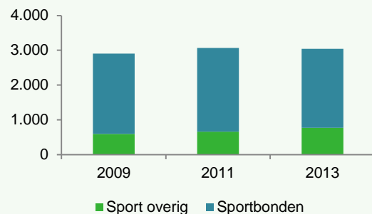
Figuur 1 Werkgelegenheid in fte