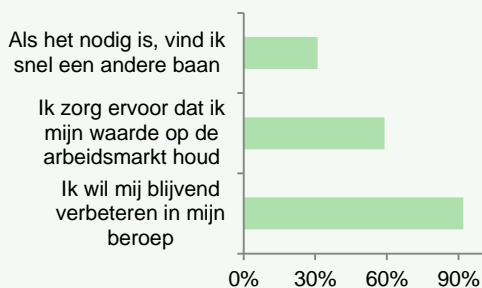
Figuur 2 Percentage werknemers (helemaal) eens met stelling (N = 195)